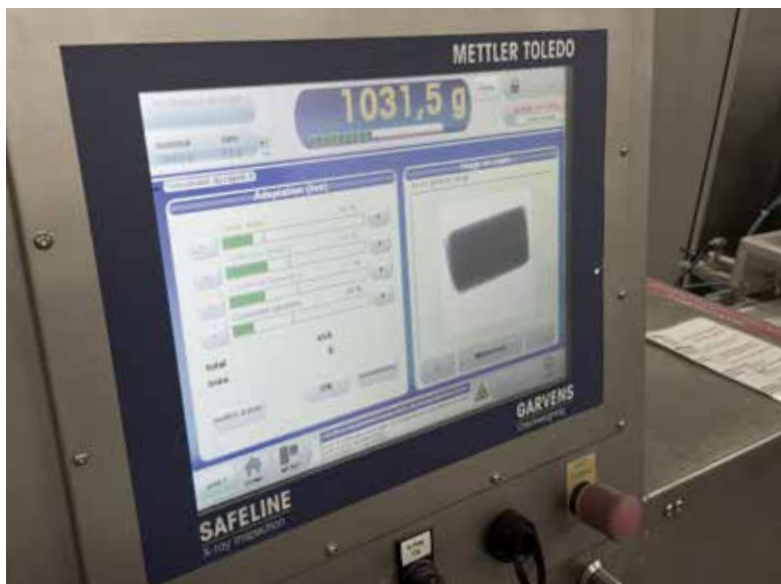
Softversko korisničko sučelje kombiniranog sustava pokazuje i rezultat vaganja i rezultat rendgenske kontrole.

Dinamični sustavi za mjerenje težine automatski jamče da se svi proizvodi važu u skladu s europskim propisima za unaprijed zapakirane proizvode. Jednako kao onečišćeni proizvodi, odmah se odbacuju i proizvodi koji nisu usklađeni s normama – na primjer nedovoljno napunjeni proizvodi. Na proizvodnim linijama proizvode se razni proizvodi različitih vrsta pakiranja. Intuitivno softversko sučelje opreme za kontrolu proizvoda i njegov veliki kapacitet za memoriranje zadanih postavki proizvoda omogućuje veoma brzu promjenu proizvoda. To, zajedno s ostalim korisnim značajkama, štedi dragocjeno vrijeme rukovatelju i povećava ukupnu učinkovitost opreme (engl. Overall Equipment Effectiveness, OEE). Osim toga, brojne mehaničke mogućnosti pružaju visok stupanj fleksibilnosti za rukovanje svakom pojedinom vrstom pakiranja i za njezin nadzor.