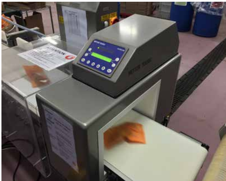
Na ključnim kontrolnim točkama (CCP-ovi) postavljenim na proizvodnim linijama sva pakiranja podliježu provjeri onečišćenja metalom kako bi se zajamčila sigurnost proizvoda prema IFS-ovim smjernicama.

koji nisu onečišćeni i čija težina odgovara onoj naznačenoj na etiketi, u skladu s europskim propisima za gotova pakiranja.