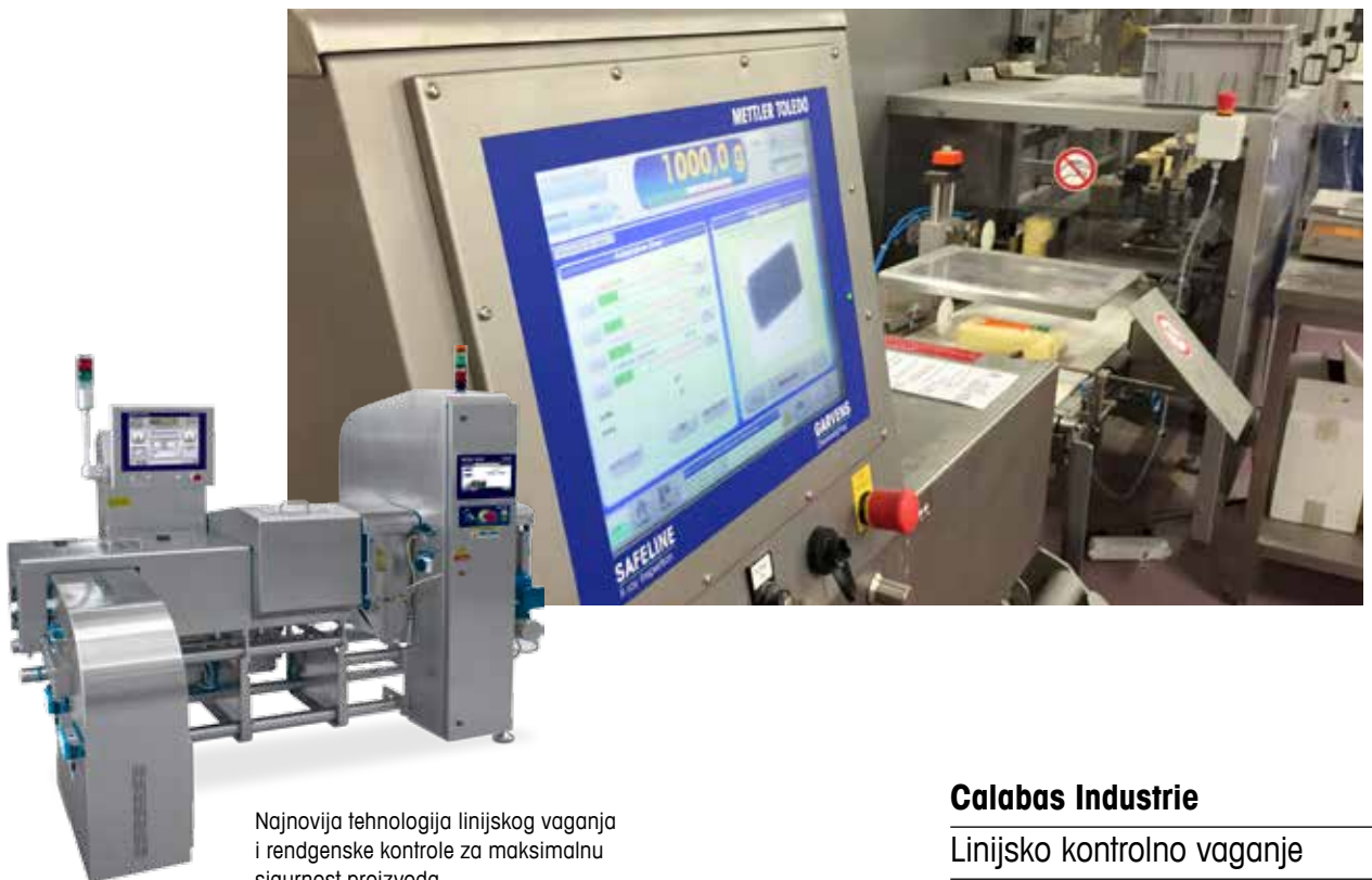
Najnovija tehnologija linijskog vaganja i rendgenske kontrole za maksimalnu sigurnost proizvoda

Francuska tvrtka Calabas Industrie, koja se specijalizirala za logistiku, skladištenje i, ponajviše, ugovorno pakiranje sušenog voća i povrća, osnovana je 2010. Otada je stekla povjerenje svojih cijenjenih klijenata. Tvrtka ne samo da nudi pouzdane, higijenske i sigurne postupke i proizvode, nego jamči i kvalitetu. Klijenti i potrošači mogu biti sigurni da će dobiti proizvode