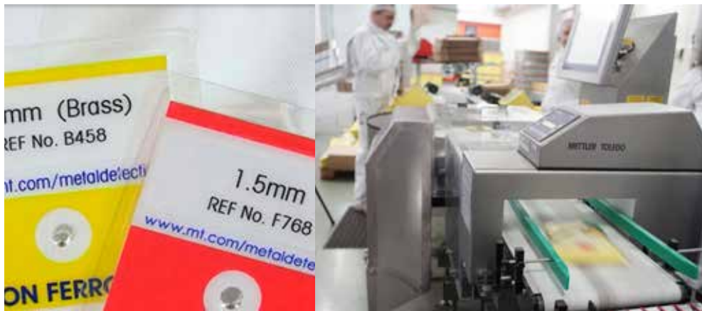
Detektori metala ispituju se pet puta tijekom svake proizvodne smjene od 8 sati.

„Primjenom softvera ProdX možemo nadzirati i optimizirati srednje vrijednosti težina ambalaže. Proaktivna priprema podataka u stvarnom vremenu pomaže nam izbjeći skupa prepunjavanja. Uspjeli smo količinu proizvodnog otpada smanjiti s 3 % na samo 0,9 %, čime smo automatski uštedjeli 2 grama po ambalaži. Drugim riječima, naše nam se ulaganje u opremu za upravljanje kontrolom isplatilo u roku od tri mjeseca.“