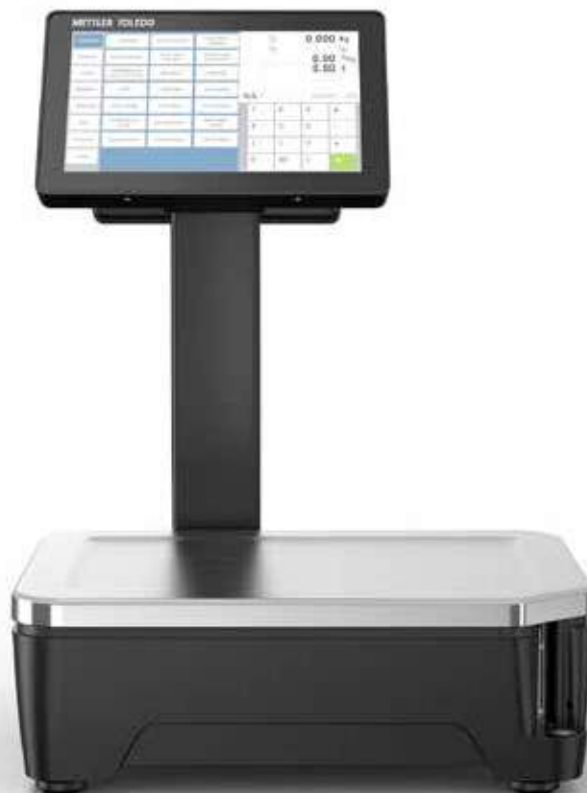
Waga FreshBase Tower

Sprawdzona funkcjonalność, bardzo korzystny stosunek możliwości do ceny: Takie są właśnie nowe wagi serii FreshBase dedykowane dla handlu detalicznego specjalizującego się w sprzedaży żywności. Wagi są wyposażone w ekran dotykowy wnoszący nowe możliwości oraz poprawiający wygodę ważenia.