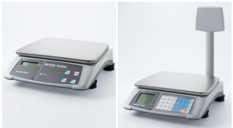
bRite Weigh Only